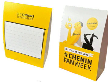
maquettes en cours