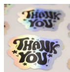
Exemple de sticker holographique